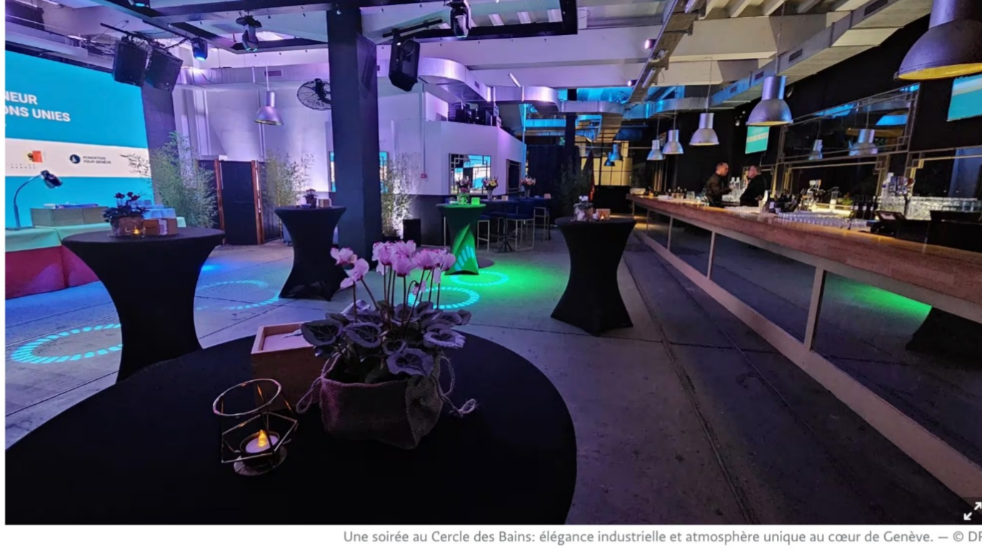
Une soirée au Cercle des Bains: élégance industrielle et atmosphère unique au cœur de Genève.

Entre verrière, béton brut et haute technologie, le Cercle des Bains s'est imposé comme l'un des lieux les plus modulables de Genève pour accueillir conférences, dîners, soirées hybrides ou lancements de produits. Visite guidée d'un espace qui conjugue esthétique forte et ingénierie événementielle